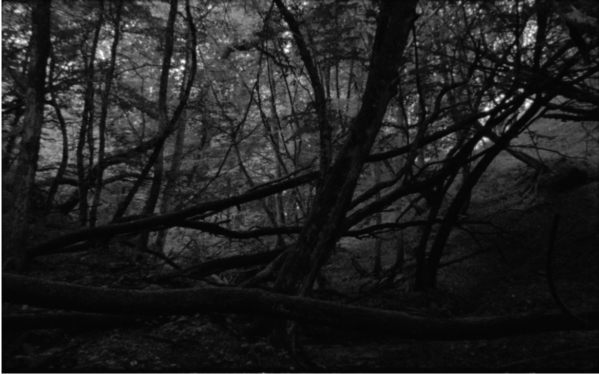
photogramme du film : la forêt dans la région de Donetsk, dense et mystérieuse