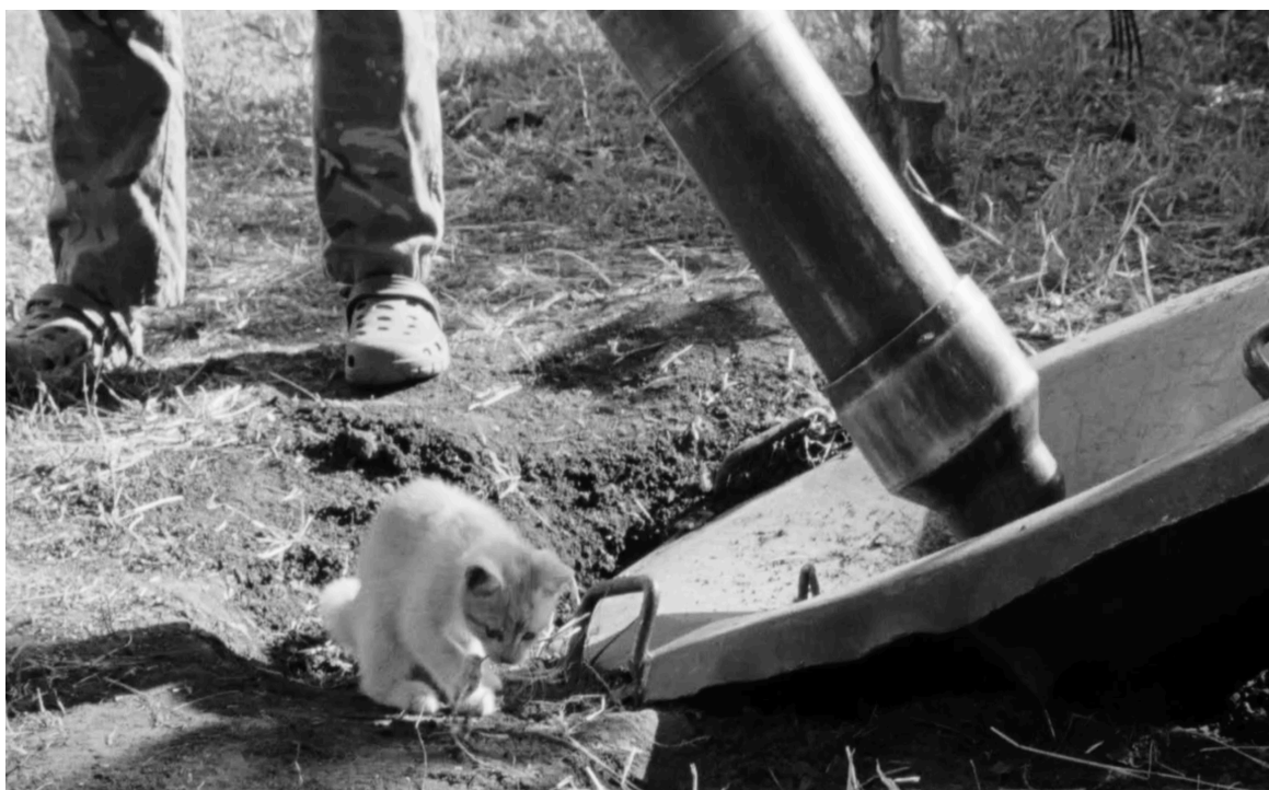
photogramme du film : initiation à l'utilisation de mortier à la Blind Fury

De la même manière que le flux numérique connecte les trois récits à l'image, nous voulons travailler cet aspect au son. Avec le musicien Dmitro Mazuriak, du groupe electro-folk ukrainien Kaska, nous avons commencé à enregistrer des sons issus d'instruments à vent traditionnels des Carpates, une corne et une cornemuse. Nous imaginons que ces sons pourraient s'ajouter ou prolonger les prises directes des sifflements des drones ou des hullements des sirènes. Les sons numériques prennent peut-être encore plus de place dans les vies de nos protagonistes que les images. Bips des drones, téléphones qui sonnent ou vibrent en permanence, sons des vidéos... Il n'y a jamais de vrais silences.